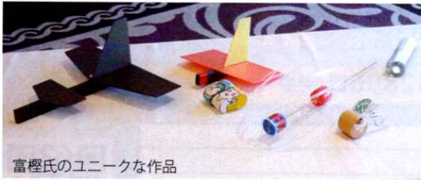
富樫氏のユニークな作品

現在に至っています。富樫先生の独創的な発想力や行動力は、発明協会や発明クラブだけでなく、広く県内外に知られるところとなっております。