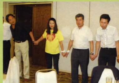
丸山君、大丈夫かー!?