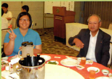
アイサさんの日本語は、 会長よりうまいとか?