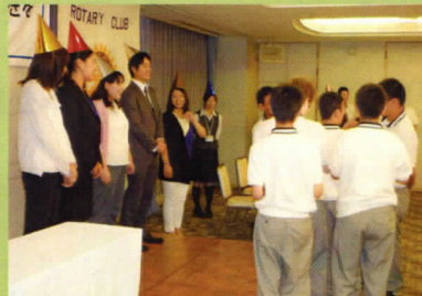
RAC「プレゼント抽選会」