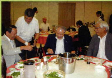
いよいよ来年! 余裕、よゆう!