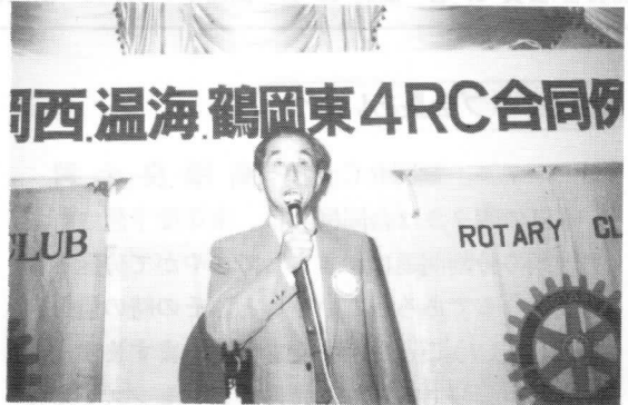
東海林太郎の歌声