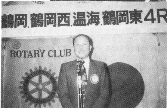
次回合同例会ポスト温海RC挨拶