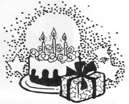
フィナーレ 手に手つないで