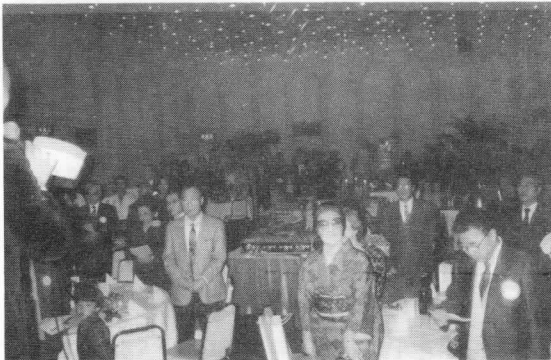
きよしこの夜斉唱