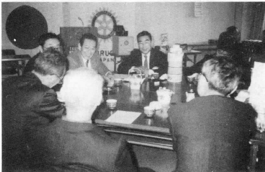
—副会長を囲んでパネル・ディスカッション—

1時から約40分にわたり、AからFまでの6つのテーブルに分散し、それぞれのテーブル・リーダーの司会で熱心な意見が交換されました。セクレタリー取りまとめ結果は、次の会報に掲載されます。