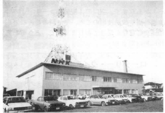
NHK鶴岡放送局 TEL (代) 22-7711