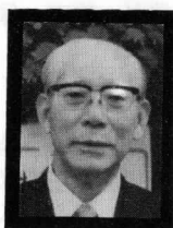
故斎藤栄作先生 を 偲 ん で