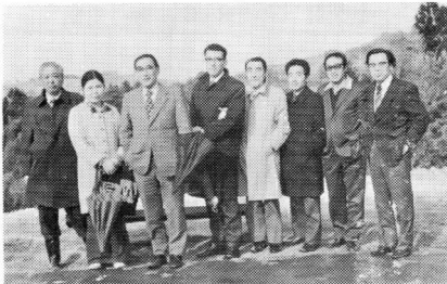
梅林公園にて会員諸兄

今後は各位の意を体し私達はこの梅林公園の栽培管理に全力を尽し湯田川温泉の梅林。梅林の湯田川温泉の名にふさわしいものにするべく努力する所存で御座いますと結んでおられます。以上のような経過をもって完成した梅林公園は面積3,056坪（9人よりの借地）工費1,100万円（県500万円、市500万円、湯田川100万円）樹木、梅約800本、牡丹200本、つつじ200本、萩20本、桃10本、外にバラ、桜、こぶし、草花をもって構成し、開花は4月中旬の梅に始まり9月中旬の萩まで順次開花があり家族連れや観光客でにぎわっている現在である。管理費は51年度予算では155万円（内除草費80万、借地代18万）を要し内、市からの補助金は60万円とのことであります。