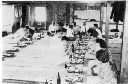
〈荒沢ダムに於て 家族会の風景〉