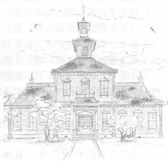
重要文化財 旧西田川郡役所