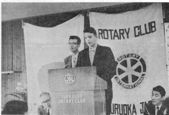
Tsuruoka Rotary Mail; On the 26th June 1962